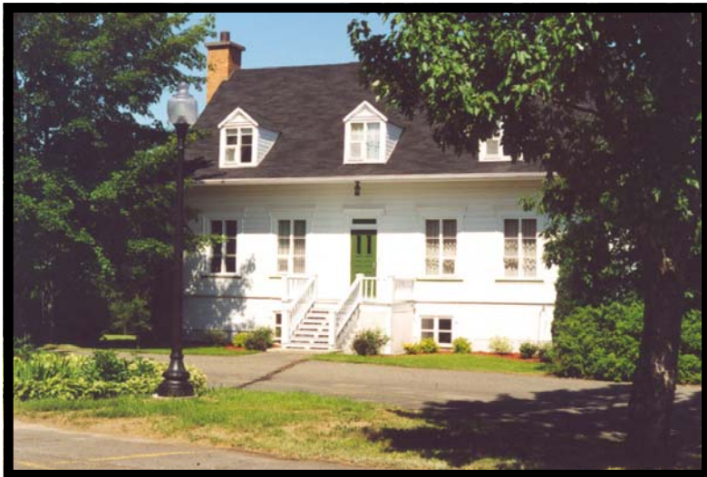
Maison Desrochers qui a servi d'évêché de 1951 à 1957