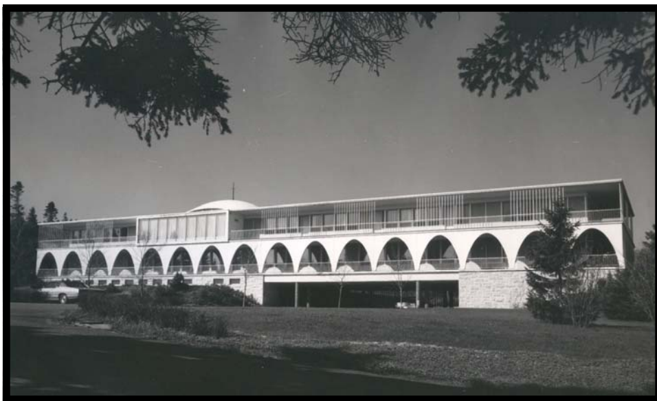
Évêché de Sainte-Anne-de-la-Pocatière (fin des années 1950)

De tout son épiscopat, la construction de l'évêché fut sans doute l'épisode le plus épineux qu'eut à défendre Mgr Desrochers. C'est à l'architecte Lucien Mainguy, bien connu à Québec pour ses nombreuses réalisations sur le campus de l'Université Laval, que l'évêque de Sainte-Anne confia les plans du futur évêché. L'architecte proposa un édifice sur deux étages de structure légère presque aérienne. Ceinturé d'une galerie limitée par une succession d'arches qui donne à l'ensemble l'apparence d'un cloître, ce qui détonnait pour ce type de construction. L'évêché était planté au milieu d'un jardin d'inspiration française dont l'entretien fut assuré bénévolement par l'agronome Charles Gagné à qui avait appartenu la ferme. Les critiques quant à l'originalité presque anachronique des plans et aux coûts de construction élevés vinrent autant des prêtres que des citoyens et tous ceux qui osèrent en faire part à l'intéressé se butèrent à des fins de non recevoir. Monseigneur avait voulu rapatrier sous un même toit tous les services administratifs et de chancellerie qui logeaient depuis huit ans, soit au presbytère de la cathédrale, soit à la Villa Saint-Jean. Ainsi, au rez-de-chaussée, se trouvaient les bureaux et services, alors que l'étage était réservé aux appartements privés, à la chapelle, à la salle à manger et à la résidence des religieuses de la Sainte-Famille qui ont assuré les services de cuisine et de ménage aussi longtemps que leur communauté put le permettre.